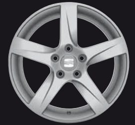
Das 17"-Leichtmetallrad „Aroa“.