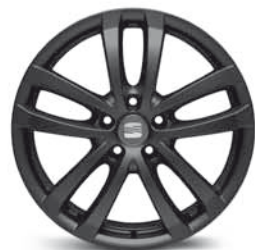
Das 18"-Leichtmetallrad „Orion“, schwarz lackiert.