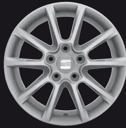
Das 16"-Leichtmetallrad „Enea“.