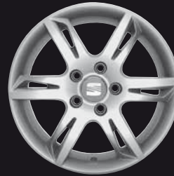
Das 16"-Leichtmetallrad „Endurance“.