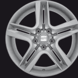
Das 17"-Leichtmetallrad „Agra“.