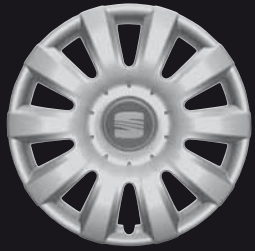
Die 15"-Radvollblende „Saona“.