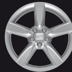
Das 18"-Leichtmetallrad „Draco“.