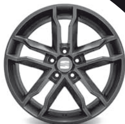
Das 18"-Leichtmetallrad „Cupra“, schwarz lackiert.