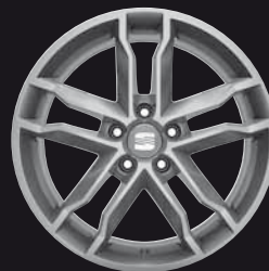
Das 18"-Leichtmetallrad „Cupra“.