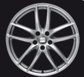
Das 19"-Leichtmetallrad „Potenza“.