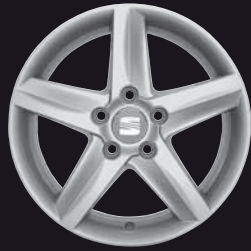
Das 16"-Leichtmetallrad „Elio“.