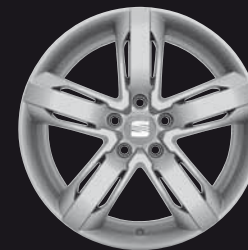
Das 18"-Leichtmetallrad „Ibera“.