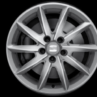
Das 15"-Leichtmetallrad „Ibia“.