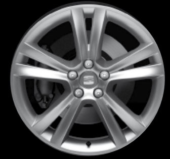
Das 17"-Leichtmetallrad „Saga“.