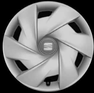
Die 15"-Radvollblende „Mamba“.