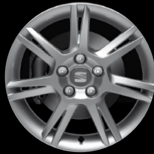
Das 15"-Leichtmetallrad „Ingenia“.