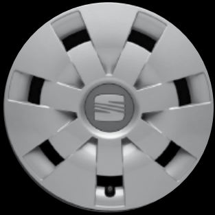
Die 14"-Radvollblende „Coloso“.