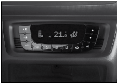
Die optionale Climatronic mit automa- tischer Temperaturregelung regelt die Innenraumtemperatur aufs Grad genau.