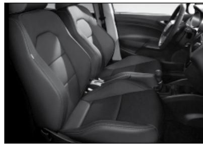
Ein Bestandteil der optionalen Leder- ausstattung: die eleganten Ledersitze.