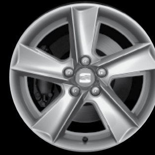
Das 16"-Leichtmetallrad „Stratos“.