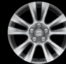
Das 17"-Leichtmetallrad „Kosta“.