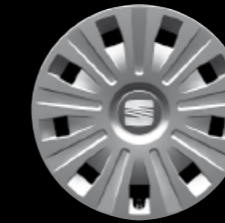
Die 16"-Radvollblende „Elodea“.

Das auf Wunsch erhältliche Panorama-Glasdach ist nahezu dreimal so groß wie ein herkömmliches Sonnendach.