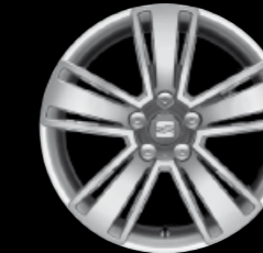
Das 17"-Leichtmetallrad „Kiroa“.