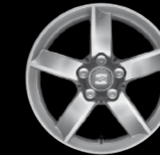
Das 16"-Leichtmetallrad „Izaros“.